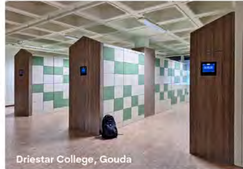
Driestar College, Gouda

De kleurstelling van de lockers kan geheel worden afgestemd op de huisstijl, waarmee de lockers naast praktisch en veilig, ook nog eens uitstekend in het interieur passen!